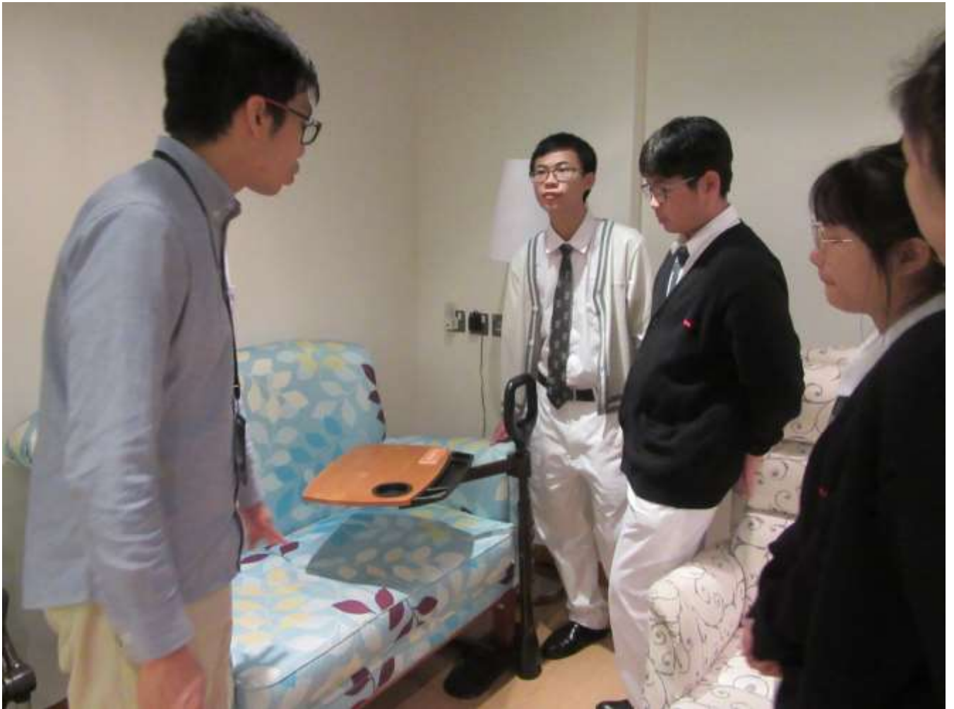
◇ 新生精神康復會石排灣綜合培訓中心